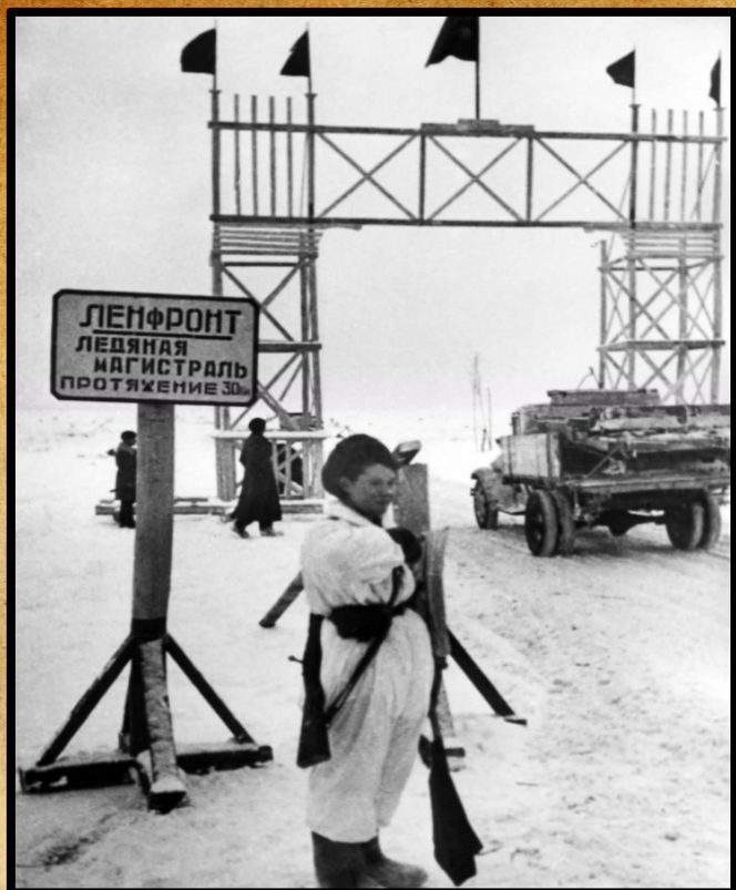
Регулировщица на въезде на «Дорогу жизни» у деревни Кокорево. Ленинградская обл. 1942